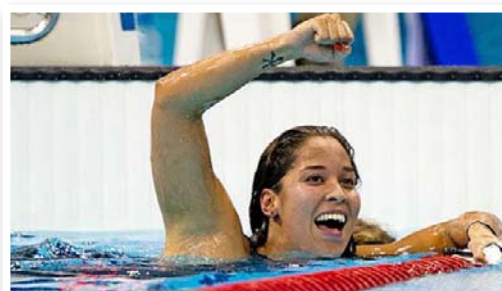
Ranomi Kromowidjojo (2011)